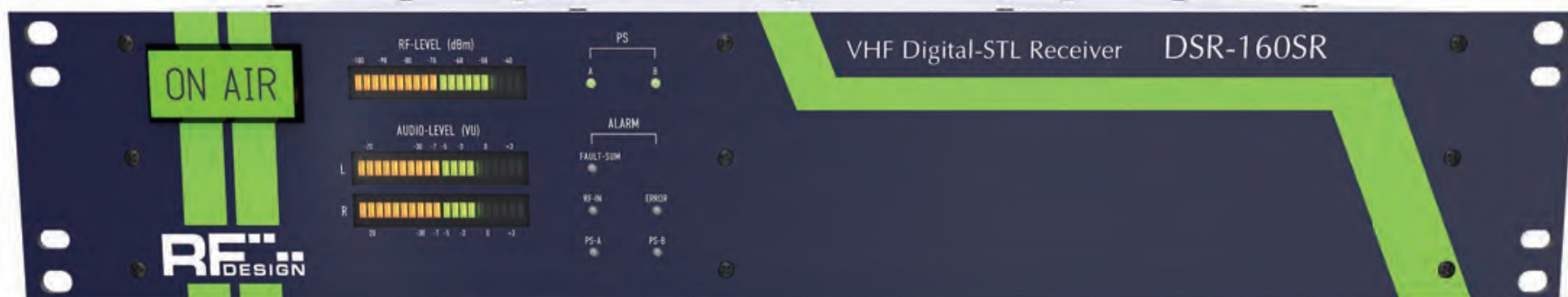
受信機 DSR-60/160SR II