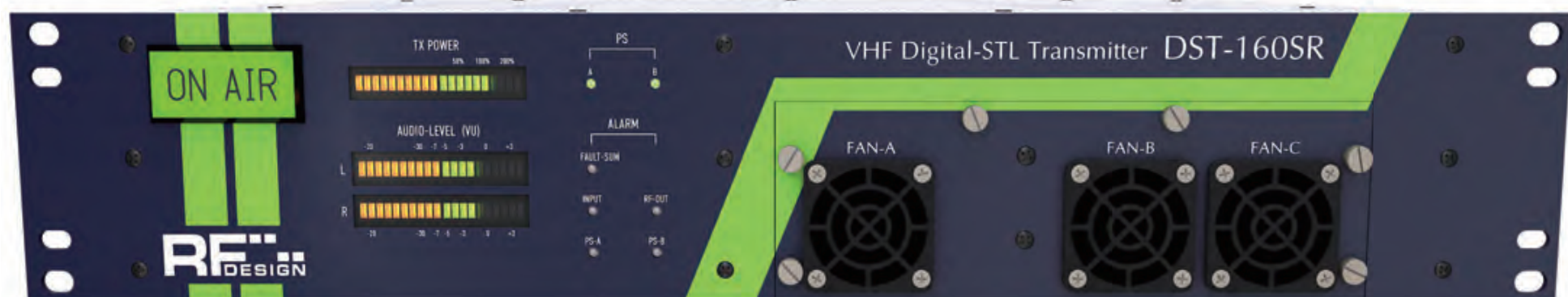
送信機 DST-60/160SR II